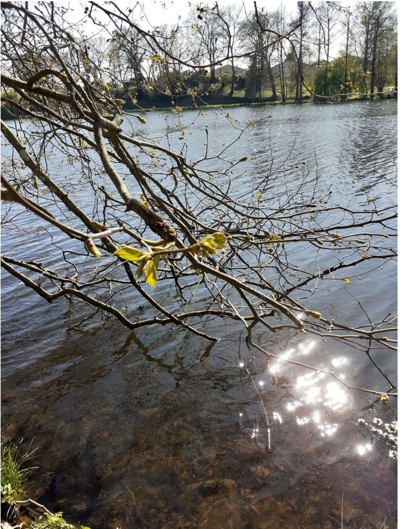
... Observé le vendredi 20 mars 2026 en bordure du lac de Christus à Saint Paul les Dax dans les Landes à 15h 45, ces branches d'un grand platane inclinées au dessus de l'eau, avec les feuilles naissantes.